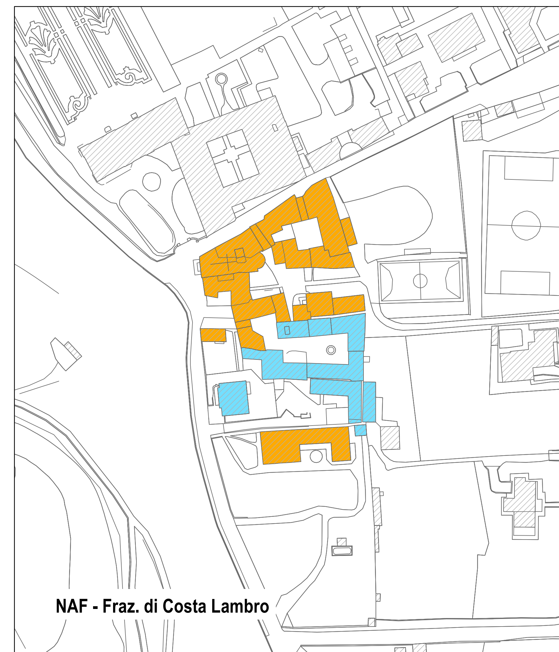
NAF - Fraz. di Costa Lambro