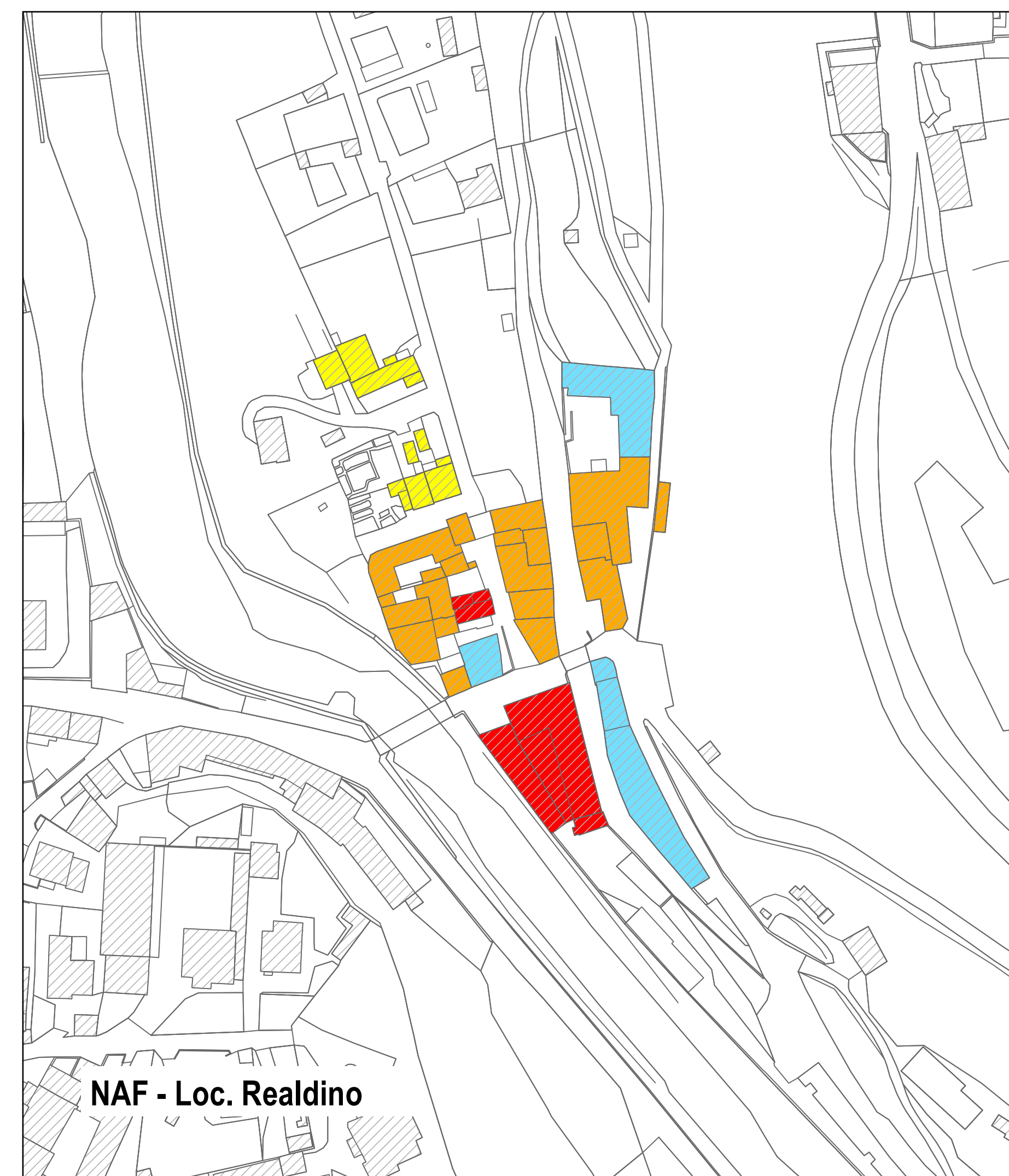
NAF - Loc. Realdino